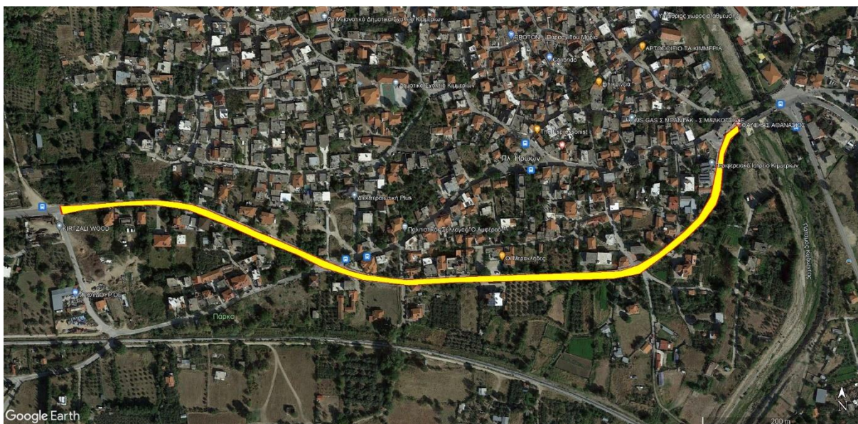
Εικ. 1: Περιοχή έργων στα Κιμμέρια (Επ. Ο. 1)

Η κατά καιρούς διέλευση δικτύων κοινής ωφέλειας από το σώμα της οδού σε συνδυασμό με την καθίζηση των скаμμάτων με την πάροδο του χρόνου, έχουν δημιουργήσει την ως άνω κατάσταση και για το λόγο αυτό οι εργασίες που έχουν προβλεφθεί, εκτός από την αντικατάσταση του ασφαλτοτάπητα, προβλέπουν και την δομική ενίσχυση αυτού με την τοποθέτηση υαλοπλεγμάτων καθόσον η ποιότητα και η συμπίκνωση των υποκείμενων στρώσεων είναι άγνωστη.