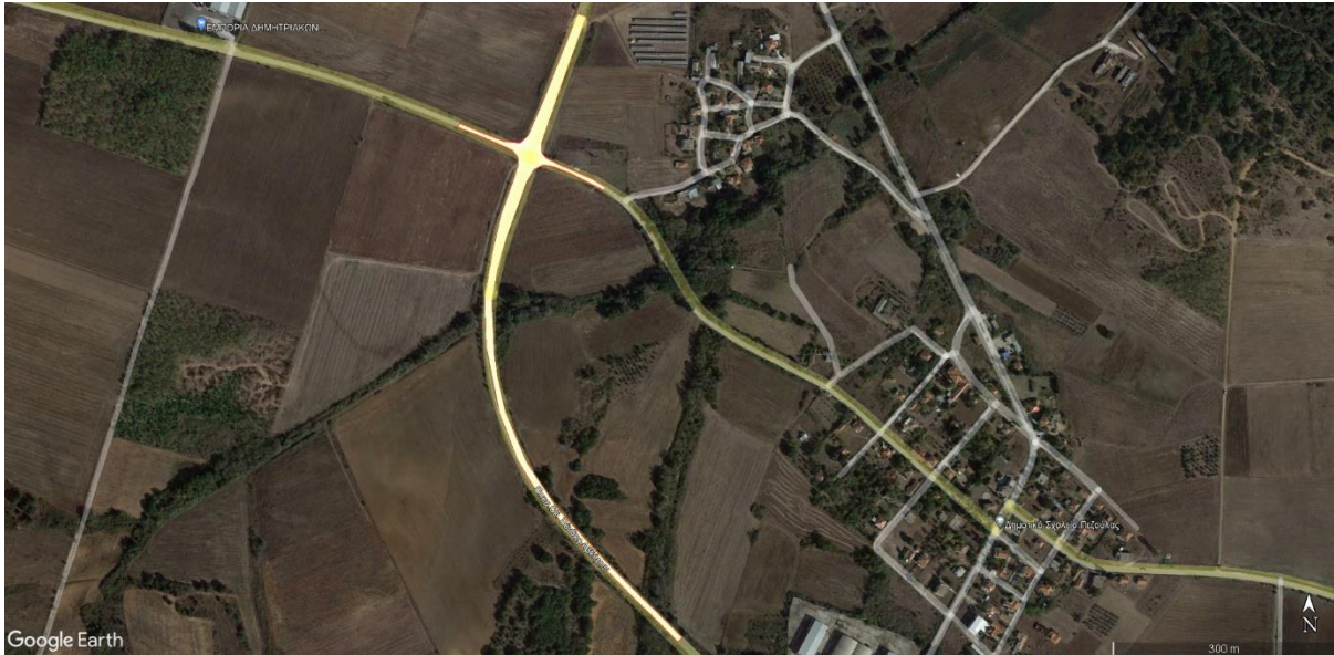
Εικ. 3: Περιοχή έργων στη διασταύρωση Επ. Ο. 8 με Δημοτική Οδό Γκιώνας - Πεζούλας

2,00μ. κάτω από τη δημοτική οδό προς Γκιώνα, περίπου στη σημερινή θέση των εσχαρών συλλογής ομβρίων.