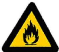
Εύφλεκτες ύλες ή/ και υψηλή θερμοκρασία