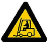
Οχήματα διακίνησης φορτίων