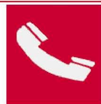
Τηλέφωνο για την καταπολέμηση πυρκαγιών

Όταν πρέπει να δείξουμε την κατεύθυνση που πρέπει να ακολουθήσουμε για να φτάσουμε στον πυροσβεστικό εξοπλισμό τότε τα αντίστοιχα σήματα συνδυάζονται ανάλογα με τα παρακάτω σήματα κατεύθυνσης