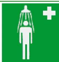
Θάλαμος καταιονισμού ασφαλείας