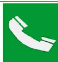
Τηλέφωνο για διάσωση και πρώτες βοήθειες

Όταν πρέπει να δείξουμε την κατεύθυνση που πρέπει να ακολουθήσουμε για να φτάσουμε στα μέσα βοήθειας ή διάσωσης τότε τα αντίστοιχα σήματα συνδυάζονται ανάλογα με τα παρακάτω σήματα κατεύθυνσης