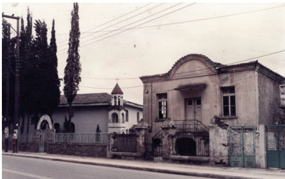
Εικόνα 1: Η εκκλησία (1834) και το σχολείο (1880) σε φωτογραφία της δεκαετίας του 1980.

Πηγή: Κασσιάν Τ., Χατζόπουλος Κ, ο.π. 284-285.