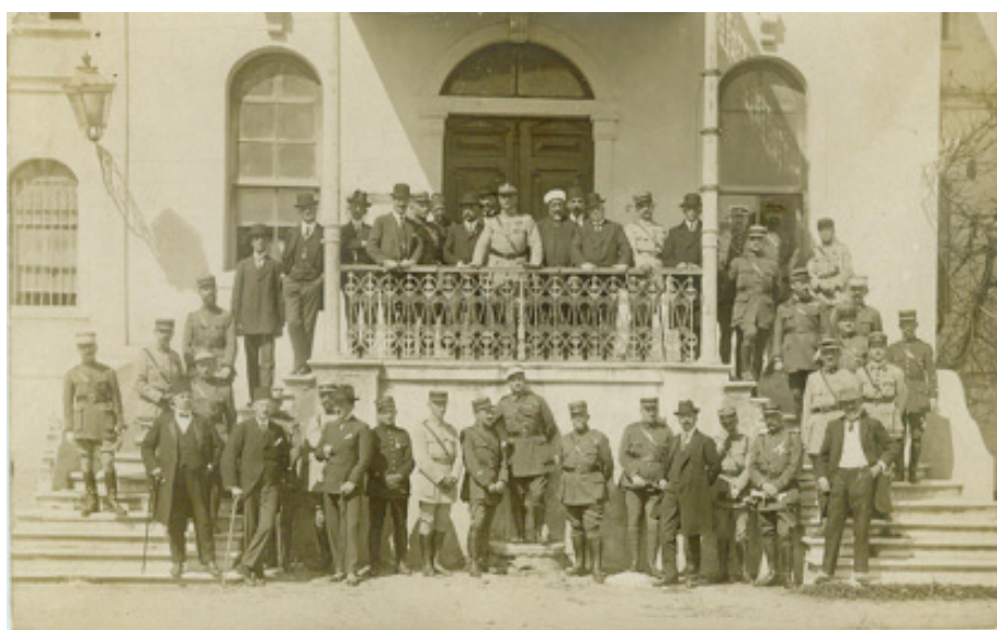
Εικόνα 2: Το Ανώτατο Συμβούλιο της Διασυμμαχικής Θράκης και Γάλλο αξιωματικοί. Στο κέντρο επάνω στον εξώστη ο στρατηγός Charpy και αριστερά του (δεξιά όπως βλέπουμε εμείς) ο Βαμβακάς με τα χέρια στο κιγκλίδωμα. Στην αριστερή πλευρά της φωτογραφίας τέταρτος πάνω στη σκάλα ο Ρουπέν Κεβορκιάν.

Πηγή: Κασσιάν Τ., Χατζόπουλος Κ, ο.π. 284-285.