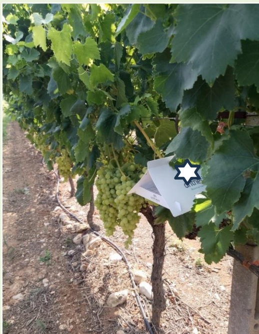
Εικόνα 1 Π.Κ.Π.Φ.Π.Φ.Ε ΚΑΒΑΛΑΣ

Το αμπέλι βρίσκεται στο στάδιο ωρίμανσης και αρχές της συγκομιδής για τις πρώιμες ποικιλίες. Με βάση τα δεδομένα από τις συλλήψεις στο δίκτυο φερομονικών παγίδων της υπηρεσίας μας, η πτήση της ευδεμίδας συνεχίζεται και υψηλοί πληθυσμοί εξακολουθούν να καταγράφονται σε περιοχές της ΠΕ Καβάλας. Ιδιαίτερη προσοχή στις πρώιμες ποικιλίες (επιτραπέζιες) οι οποίες βρίσκονται ήδη στο στάδιο της συγκομιδής. Οι ψεκάσμοι να πραγματοποιούνται με βιολογικά σκευάσματα ή και σκευάσματα με βάση το βάκιλο θουριγγίας ( Bacillus thuringiensis ) λόγω μικρής υπολειμματικής διάρκειας και με κατεύθυνση αποκλειστικά στη ζώνη των σταφυλιών. Ιδιαίτερη προσοχή στο χρονικό διάστημα που μεσολαβεί από την τελευταία εφαρμογή έως την συγκομιδή.