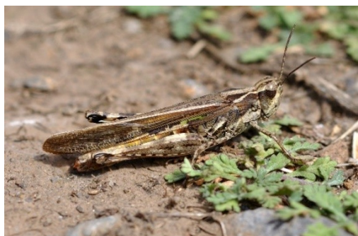
Dociostaurus maroccanus (Ενήλικο)

Το σημαντικότερο είδος στην περιοχή μας είναι το: Calliptamus italicus και Dociostaurus maroccanus (Orthoptera: Acrididae)