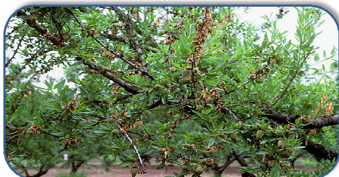
Εικόνα2. Μονιλία