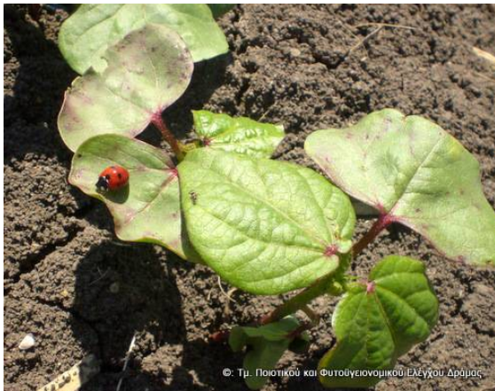
Η κοινή πασχαλίτσα ( Coccinella septempunctata ) σε βαμβακόφυτο (φωτ. 19-05-2021)