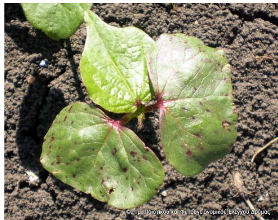
Συμπτώματα βακτηριακής κηλίδωσης σε κοτυληδόνες βαμβακοφύτου (φωτ. 19-05-2021)