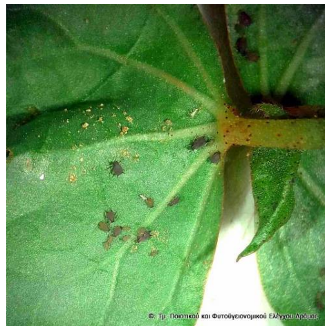
Αφίδες τού βαμβακιού ( Aphis gossypii ) σε βαμβακόφυτο (φωτ. 12-05-2021)