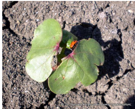
Η κοινή πασχαλίτσα ( Coccinella septempunctata ) σε βαμβακόφυτο (φωτ. 19-05-2021)