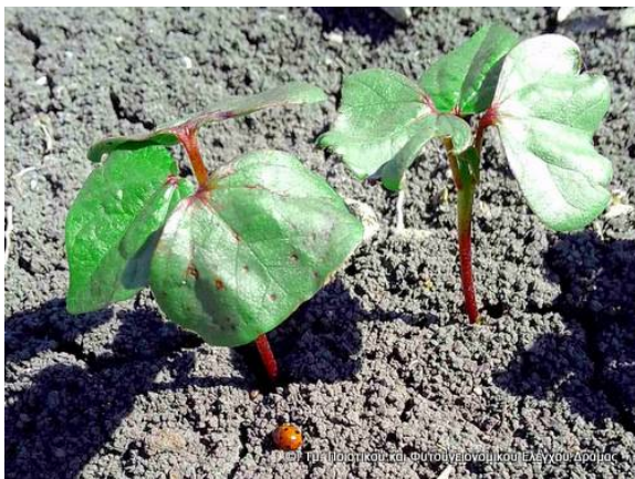
Η κοινή πασχαλίτσα ( Coccinella septempunctata ) σε βαμβακόφυτο (φωτ. 19-05-2021)