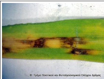
Εικόνα 1. Κηλίδες ελμινθοσπορίου σε κριθάρι