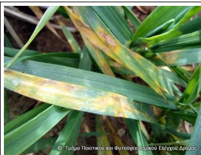
Εικόνα 2. Κηλίδες ελμινθοσπορίου σε κριθάρι