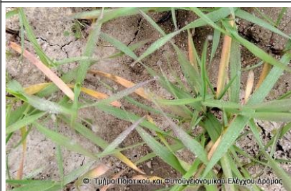
Εικόνα 4. Προσβολή σεπτορώσης σε σιτάρι