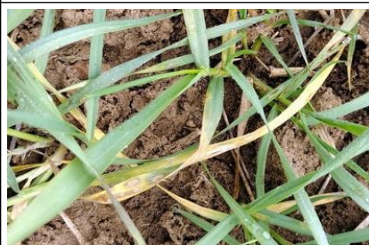
Εικόνα 5. Προσβολή σεπτορώσης σε σιτάρι