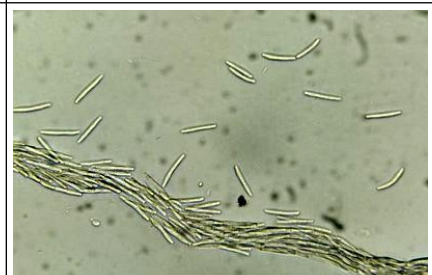
Εικόνα 6. Κονίδια ( Parastagonospora nodorum )