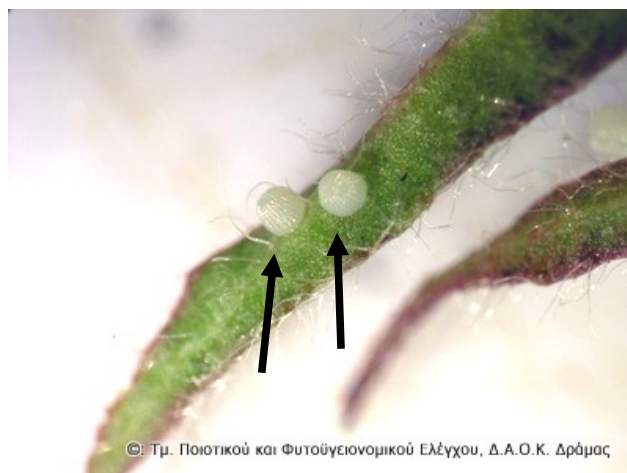
Αβγό σε μεγέθυνση