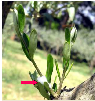
Εικόνα 6: Προσβολή ελιάς από νύμφη (μέσα στον αφρό που παράγει) του εντόμου Philaenus spumarius σε περιοχή της Π.Ε. Δράμας. Το έντομο είναι κοινότατο στη Χώρα μας και συναντάται τόσο σε αυτοφυή φυτά, όσο και σε καλλιεργούμενα. (Φωτ. ©: Τμήμα ΠΦΕ, ΔΑΟΚ Δράμας).

κοινότατο στη Χώρα μας (Εικόνες 5 και 6). Η μετάδοση γίνεται ταχύτατα, ύστερα από δύο ωρών διατροφή του εντόμου σε μολυσμένο φυτό, χωρίς να μεσολαβεί κάποια περίοδος επώασης στον φορέα και το έντομο παραμένει μολυσματικό σε όλη την διάρκεια της ζωής του.