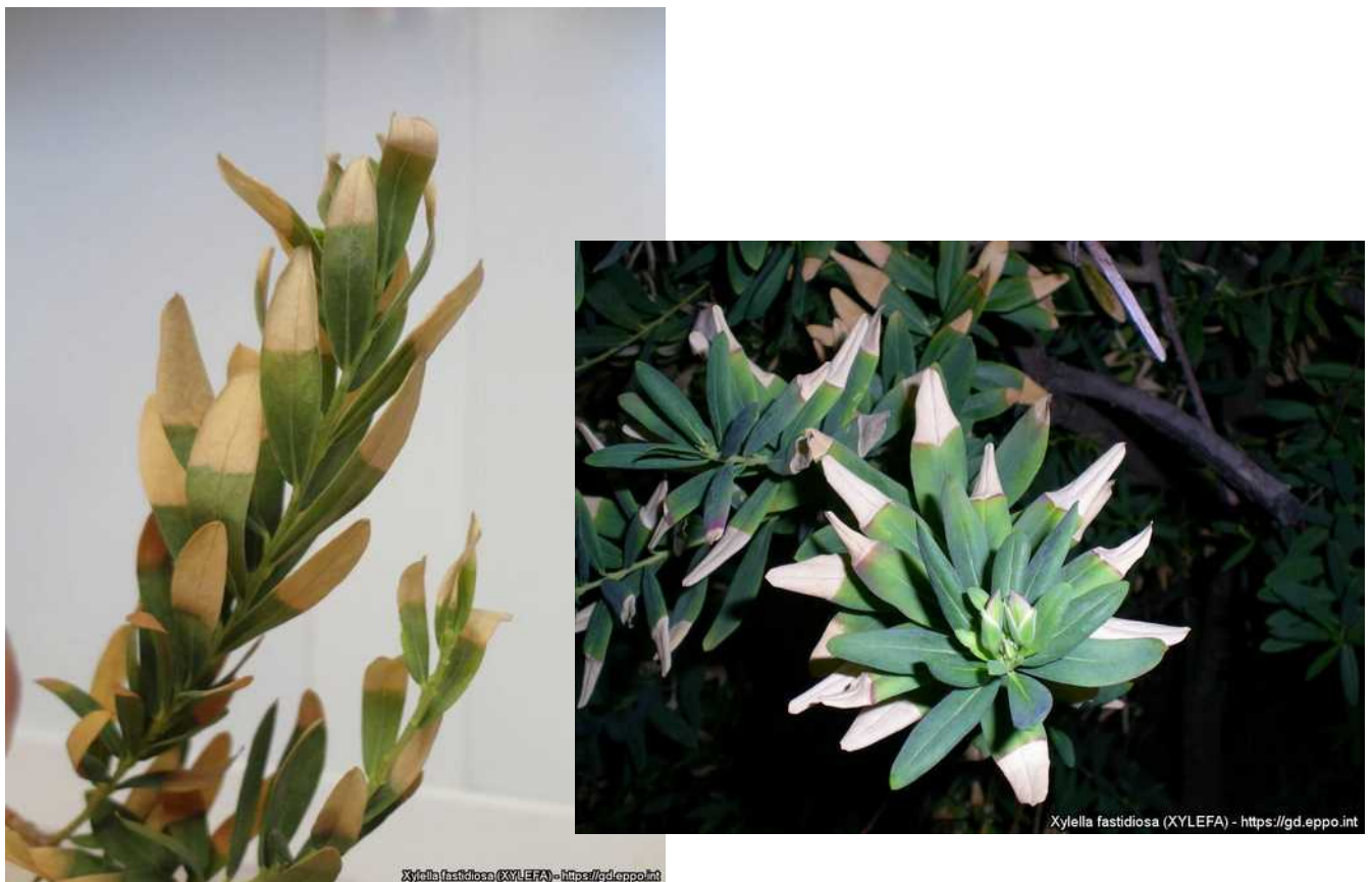
Συμπτώματα προσβολής από Xylella fastidiosa σε πολύγαλα (καλλωπιστικό φυτό).