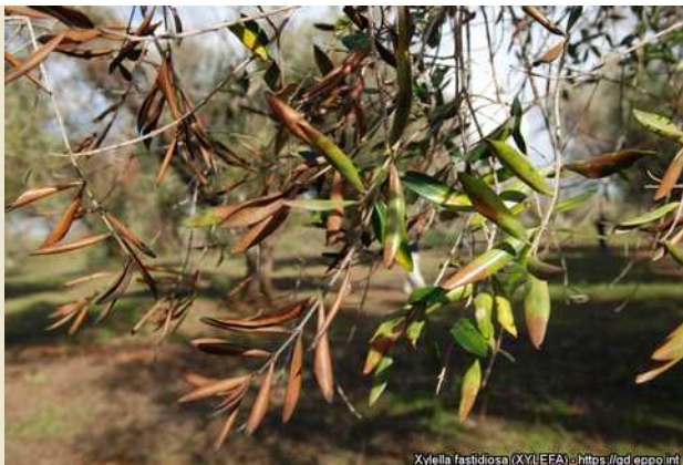
Εικόνα 1: Συμπτώματα του Xylella fastidiosa σε ελιά (πηγή: EPPO).

Η ασθένεια επιβεβαιώθηκε στην ελιά, αμυγδαλιά, πικροδάφνη, καρυδιά, κερασιά, βερικοκιά, άμπελο, λεβάντα, πελαργόνιο, δενδρολίβανο και πολλά άλλα φυτά, με συμπτώματα ξηράνσεων στα φύλλα και ταχύτατης αποπληξίας κατά τις θερμές περιόδους του έτους. Το εν λόγω παθογόνο εντάχθηκε από το 2014 στο ετήσιο πρόγραμμα επισκοπήσεων επιβλαβών οργανισμών, για τη διαπίστωση της παρουσίας του ή μη στη Χώρα μας και της τυχόν διασποράς του.