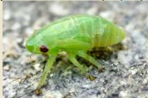
Νύμφη (μετά την αφαίρεση του αφρού που παράγει)