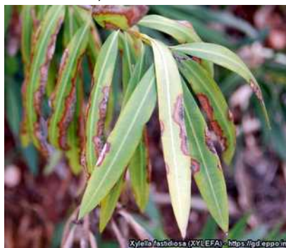
Εικόνα 3: Συμπτώματα του Xylella fastidiosa σε πικροδάφνη.

Το βακτήριο έχει πολλά υποείδη και πολλούς ξενιστές. Οι κυριότεροι ξενιστές του είναι η ελιά , η άμπελος , η αμυγδαλιά , η ροδακινιά , η βερικοκιά , η δαμασκηλιά , οι βελανιδιές , τα εσπεριδοειδή , η μηδική , διάφορα ζιζάνια όπως ο βέλιουρας και άλλα. Εκτεταμένες περιοχές με ελαιώνες στην Ιταλία και Ισπανία έχουν προσβληθεί από το παθογόνο. Ειδικότερα, ευπαθή φυτά στο στέλεχος του βακτηρίου που προσβάλλει την ελιά είναι και τα παρακάτω είδη: αμυγδαλιά, κερασιά, τομάτα, μελιτζάνα, δενδρολίβανο, μυρτιά, σπάρτιο, ράμνος και πολλά άλλα καλλωπιστικά (βλ. πίνακα φυτών-ξενιστών, σελ. 4 ).