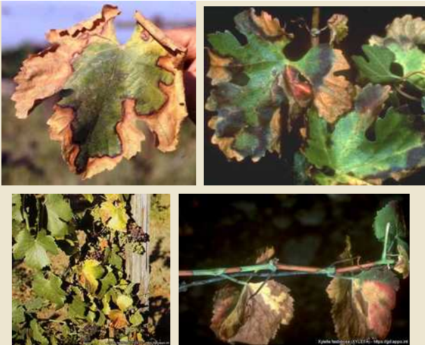
Εικόνα 4: Συμπτώματα του Xylella fastidiosa σε άμπελο («ασθένεια του Pierce») (Πηγή: ΕΡΡΟ).

Η ξήρανση περιβάλλεται από κίτρινη ή κοκκινωπή ζώνη. Μετά την πτώση του φύλλου ο μίσχος παραμένει προσκολλημένος στην κληματίδα. Παρατηρείται ανομοιόμορφη ωρίμαση των κληματιδών, καθώς και μικροφυλλία και χλώρωση που θυμίζει τροφопτενία.