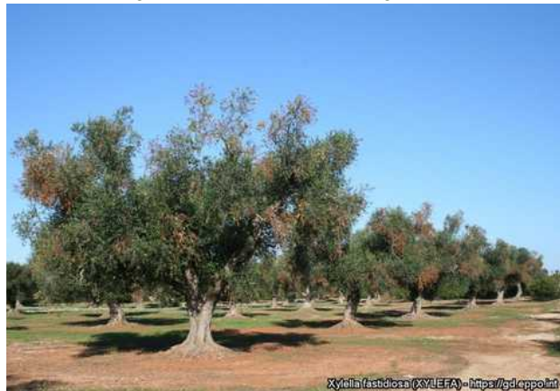
Εικόνα 2: Συμπτώματα του Xylella fastidiosa σε ελιές. Η συμπτωματολογική αυτή εικόνα μπορεί να οφείλεται σε φλοιοφάγα έντομα (φλοιοτρίβης, Euzophera bigella κ.α.), μύκητες ( Verticillium dahliae , Phoma incompta , Pseudocercospora cladosporioides ) ή και τροφοπενίες (καλίου ή βορίου). Τα συμπτώματα δεν είναι παθογνωμονικά.

Το Xylella fastidiosa μολύνει μεγάλο αριθμό ειδών φυτών που μπορεί να μην εμφανίζουν συμπτώματα και να λειτουργούν έτσι ως πηγές μόλυσματος για τα έντομα φορείς του.