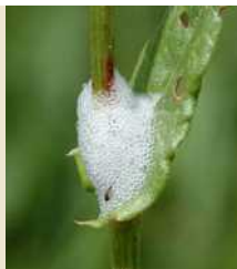
Προσβολή από νύμφη