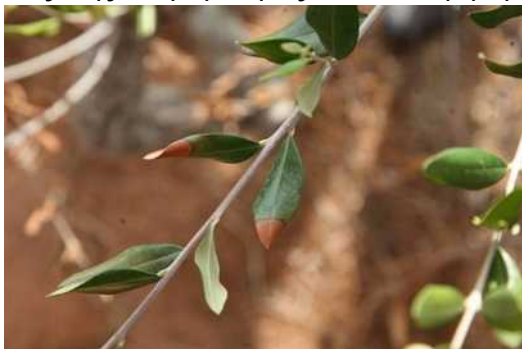
Εικόνα 1: Συμπτώματα του Xylella fastidiosa σε ελιά (πηγή: EPPO).

Η ασθένεια αρχικώς επιβεβαιώθηκε στην Ιταλία σε πολλά φυτικά είδη μεταξύ των οποίων η ελιά , η αμυγδαλιά , η πικροδάφνη και η βελανιδιά με συμπτώματα ξηράνσεων στα φύλλα και ταχύτατης αποπληξίας κατά τις θερμές περιόδους του έτους. Αυτή ήταν η πρώτη αναφορά επιβεβαιωμένης παρουσίας του Xylella fastidiosa στην επικράτεια της Ευρωπαϊκής Ένωσης, καθώς και η πρώτη φορά που διαπιστώνεται η ασθένεια σε ελιές («Σύνδρομο ταχείας παρακμής της ελιάς»). Εξαιτίας της σοβαρότητας του αναφερόμενου