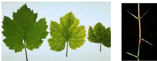
Εικόνα 3: Συμπτώματα του Xylella fastidiosa σε άμπελο («ασθένεια του Pierce»).

Η ξήρανση περιβάλλεται από κίτρινη ή κοκκινωπή ζώνη. Μετά την πτώση του φύλλου ο μίσχος παραμένει προσκολλημένος στην κληματίδα. Παρατηρείται ανομοιόμορφη ωρίμαση των κληματιδών, καθώς και μικροφυλλία και χλώρωση που θυμίζει τροφопενία ψευδαργύρου.