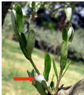
Εικόνα 5: Προσβολή ελιάς από νύμφη του εντόμου Philaenus spumarius.

έντομο παραμένει μολυσματικό σε όλη την διάρκεια της ζωής του.