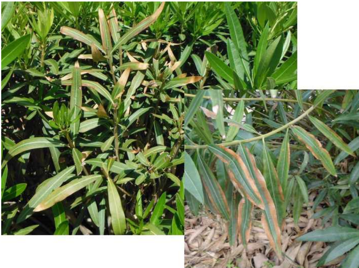
Συμπτώματα προσβολής πικροδάφνης από Xylella fastidiosa .