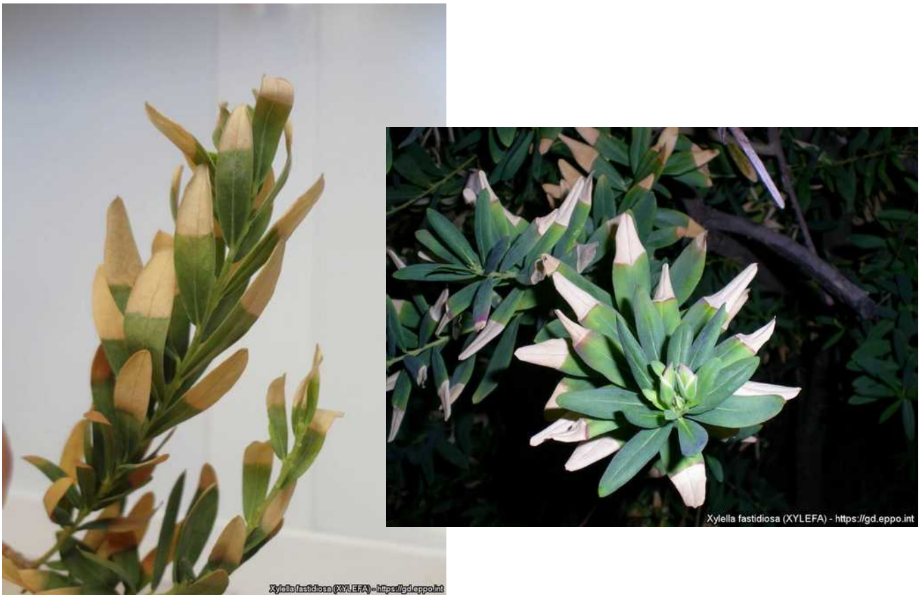
Συμπτώματα προσβολής από Xylella fastidiosa σε πολύγαλα (καλλωπιστικό φυτό) (EPPO).