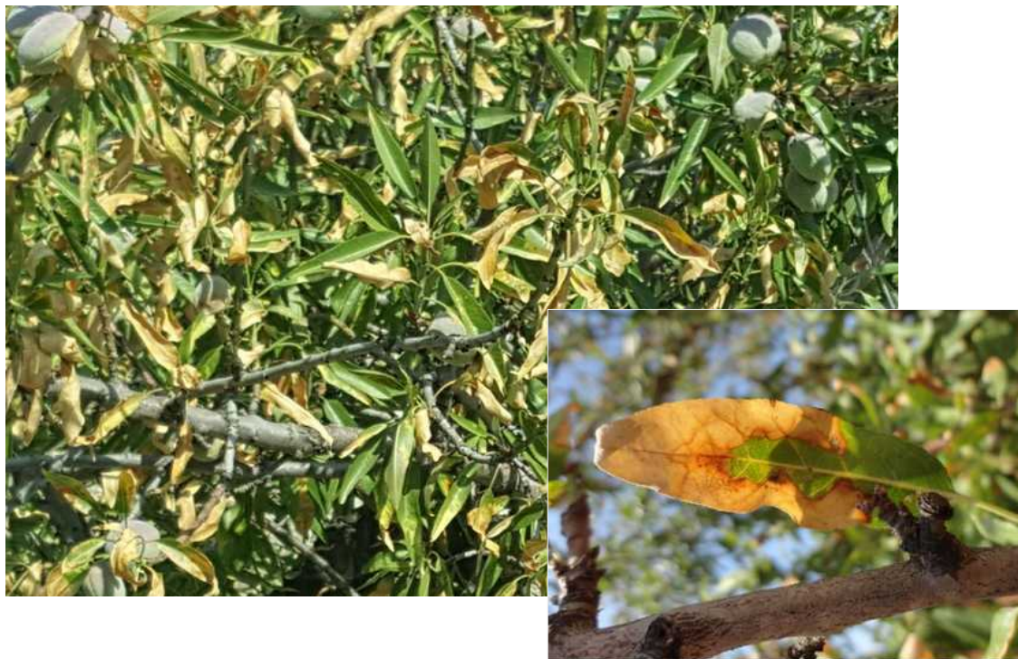
Συμπτώματα προσβολής αμυγδαλιάς από Xylella fastidiosa .