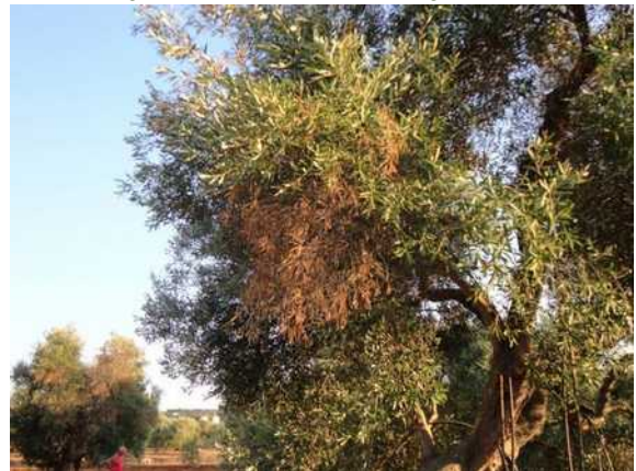
Εικόνα 2: Συμπτώματα του Xylella fastidiosa σε ελιά. Η συμπτωματολογική αυτή εικόνα μπορεί να οφείλεται σε φλοιοφάγα έντομα (φλοιοτρίβης, Euzophera bigella κ.α.), μύκητες ( Verticillium dahliae , Phoma incompta , Pseudocercospora cladosporioides ) ή και τροφοπενίες (καλίου ή βορίου) και γι' αυτό απαιτείται προσοχή.

Το Xylella fastidiosa μολύνει μεγάλο αριθμό ειδών φυτών που μπορεί να μην εμφανίζουν συμπτώματα και να λειτουργούν έτσι ως πηγές μόλυσματος για τα έντομα φορείς του.