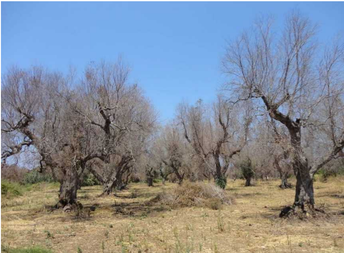
Προσβεβλημένα ελαιόδενδρα από Xylella fastidiosa στην Απουλία.