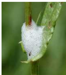
Προσβολή από προνύμφη