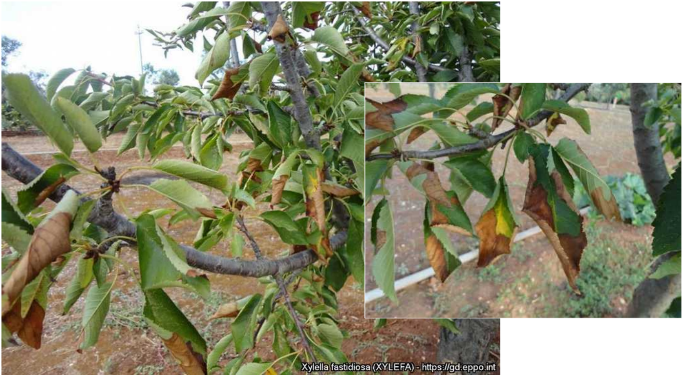
Συμπτώματα προσβολής κερασιάς από Xylella fastidiosa (EPPO).