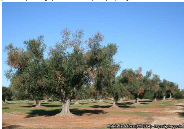
Εικόνα 2: Συμπτώματα του Xylella fastidiosa σε ελιές. Η συμπτωματολογική αυτή εικόνα μπορεί να οφείλεται σε φλοιοφάγα έντομα (φλοιοτρίβης, Euzophera bigella κ.α.), μύκητες ( Verticillium dahliae , Phoma incompta , Pseudocercospora cladosporioides ) ή και τροφωπενίες (καλίου ή βορίου). Τα συμπτώματα δεν είναι παθογνωμονικά.

Το Xylella fastidiosa μολύνει μεγάλο αριθμό ειδών φυτών που μπορεί να μην εμφανίζουν συμπτώματα και να λειτουργούν έτσι ως πηγές μόλυσματος για τα έντομα φορείς του.