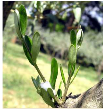
Εικόνα 6: Προσβολή ελιάς από νύμφη (μέσα στον αφρό που παράγει) του εντόμου Philaenus spumarius σε περιοχή της Π.Ε. Δράμας. Το έντομο είναι κοινότατο στη Χώρα μας και συναντάται τόσο σε αυτοφυή φυτά, όσο και σε καλλιεργούμενα. (Φωτ. ©: Τμήμα ΠΦΕ, ΔΑΟΚ Δράμας).

κοινότατο στη Χώρα μας (Εικόνες 5 και 6). Η μετάδοση γίνεται ταχύτατα, ύστερα από δύο ωρών διατροφή του εντόμου σε μολυσμένο φυτό, χωρίς να μεσολαβεί κάποια περίοδος επώασης στον φορέα και το έντομο παραμένει μολυσματικό σε όλη την διάρκεια της ζωής του.