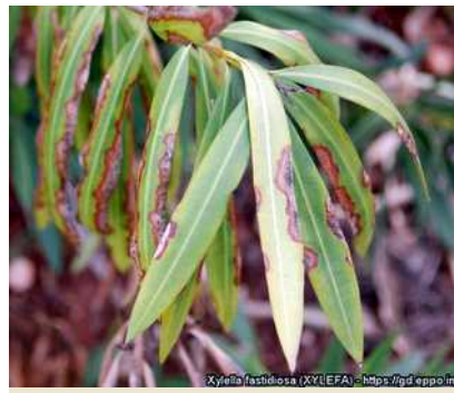
Εικόνα 3: Συμπτώματα του Xylella fastidiosa σε πικροδάφνη.

Το βακτήριο έχει πολλά υποείδη και πολλούς ξενιστές. Οι κυριότεροι ξενιστές του είναι η ελιά, η άμπελος, η αμυγδαλιά, η ροδακινιά, η βερικοκιά, η δαμασκηλιά, οι βελανιδιές, τα εσπεριδοειδή, η μηδική, διάφορα ζιζάνια όπως ο βέλιουρας και άλλα. Εκτεταμένες περιοχές με ελαιώνες στην Ιταλία και Ισπανία έχουν προσβληθεί από το παθογόνο. Ειδικότερα, ευπαθή φυτά στο στέλεχος του βακτηρίου που προσβάλλει την ελιά είναι και τα παρακάτω είδη: αμυγδαλιά, κερασιά, τομάτα, μελιτζάνα, δενδρολίβανο, μυρτιά, σπάρτιο, ράμνος και πολλά άλλα καλλωπιστικά (βλ. πίνακα φυτών-ξενιστών, σελ. 4 ).