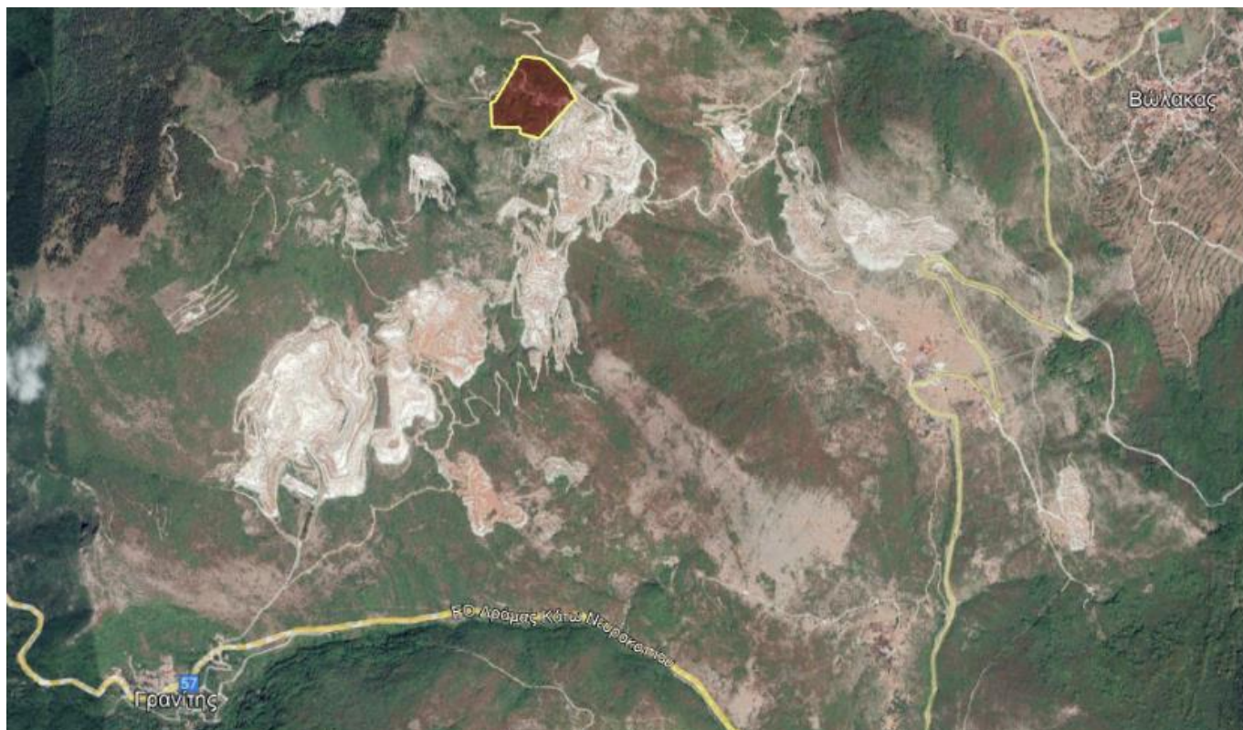
Απόσπασμα Google Earth.