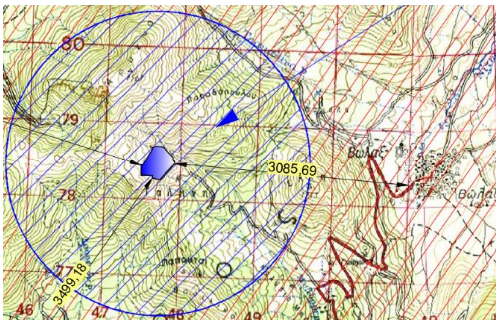
Απόσπασμα χάρτη προσανατολισμού.

Η περιοχή όπου βρίσκεται ο λατομικός χώρος είναι δημόσια δασική έκταση, υπάγεται διοικητικά στην Π.Ε. Δράμας.