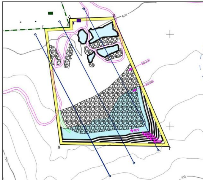
Εικόνα 4. Απόσπασμα χάρτη «Χάρτης τελικής κατάστασης».