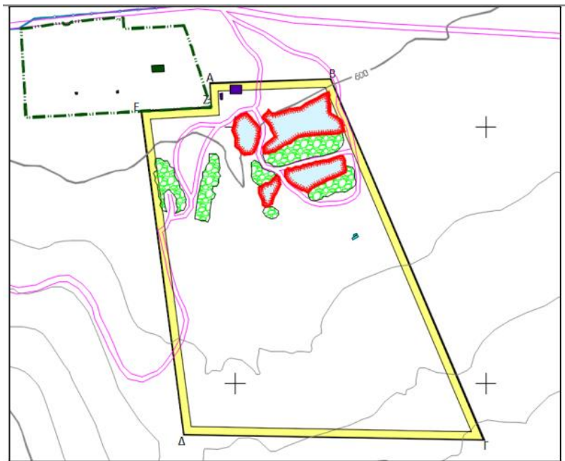
Εικόνα 2. Απόσπασμα χάρτη «Χάρτης υφιστάμενης κατάστασης».