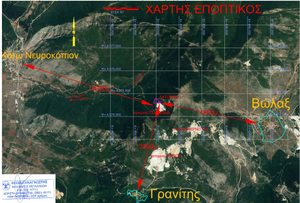
Απόσπασμα χάρτη γενικού προσανατολισμού

Η λατομική έκταση βρίσκεται 3,8 km ΒΔ του οικισμού Γρανίτη, σε δημόσια δασική έκταση και αντικείμενο της έρευνας αποτελεί το κοίτασμα δολομιτικού μαρμάρου της περιοχής.