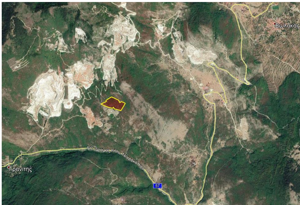
Εικόνα 2. Απόσπασμα Google Earth.