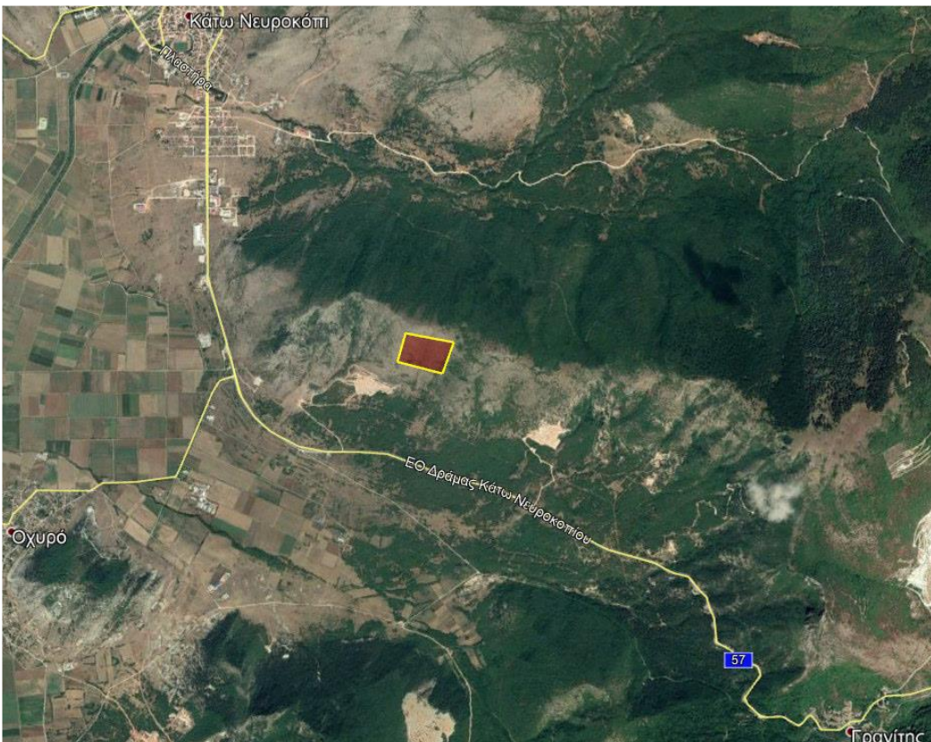
Εικόνα 2. Απόσπασμα Google Earth.

Η περιοχή που πρόκειται να γίνουν οι εργασίες εκμετάλλευσης, είναι ορεινή ημιορεινή δασική έκταση, με κλίση της τάξης του 55%, σε υψόμετρο 820 - 990 περίπου μέτρων. Η βλάστηση που υπάρχει στην περιοχή αποτελείται κυρίως από πλατύφυλλη και θαμνώδη βλάστηση.