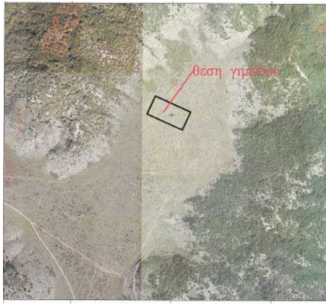
Θέση προτεινόμενου αμπελώνα

Αναφορικά με την Ειδική Οικολογική Αξιολόγηση της δραστηριότητας που συνοδεύει τον εν λόγω φάκελο :