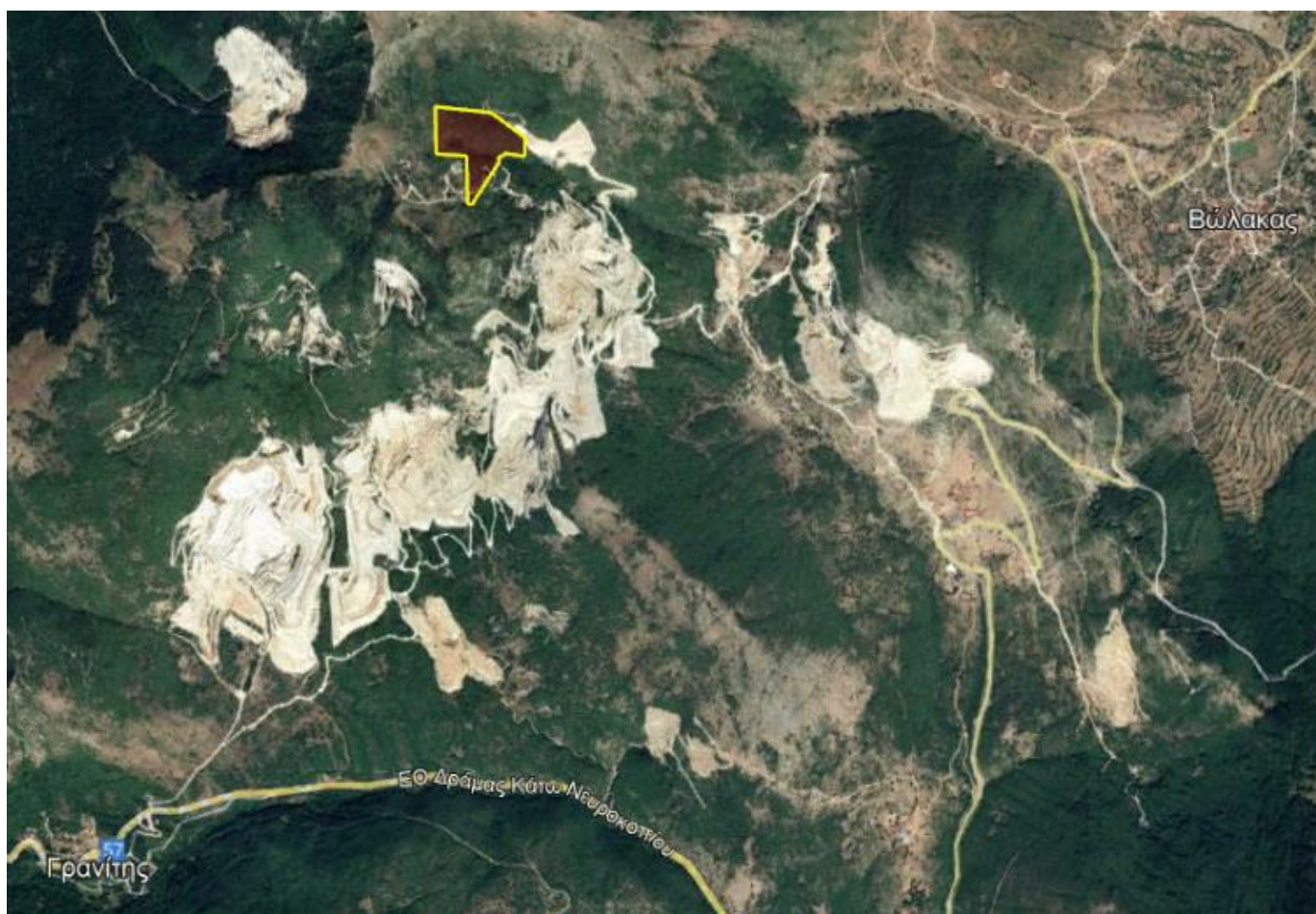
Απόσπασμα Google Earth.