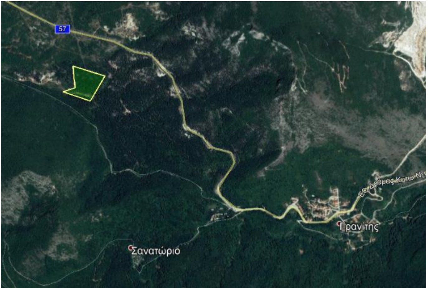
Απόσπασμα Google Earth.