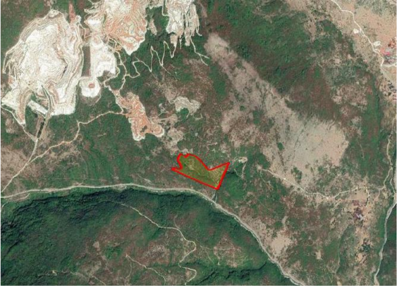
Απόσπασμα Google Earth.