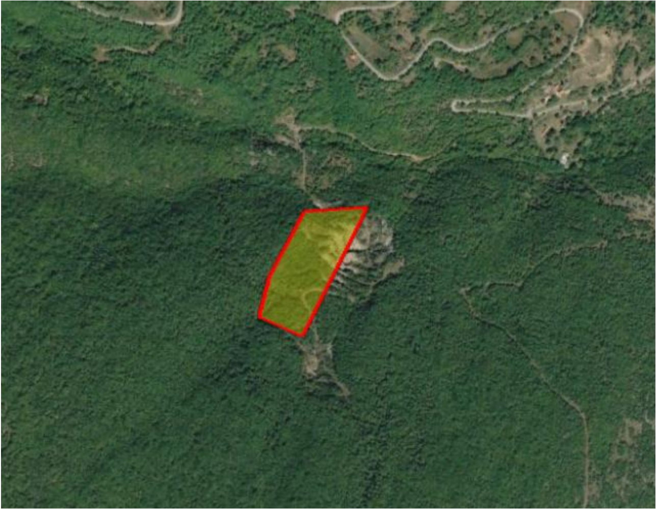
Απόσπασμα Google Earth.