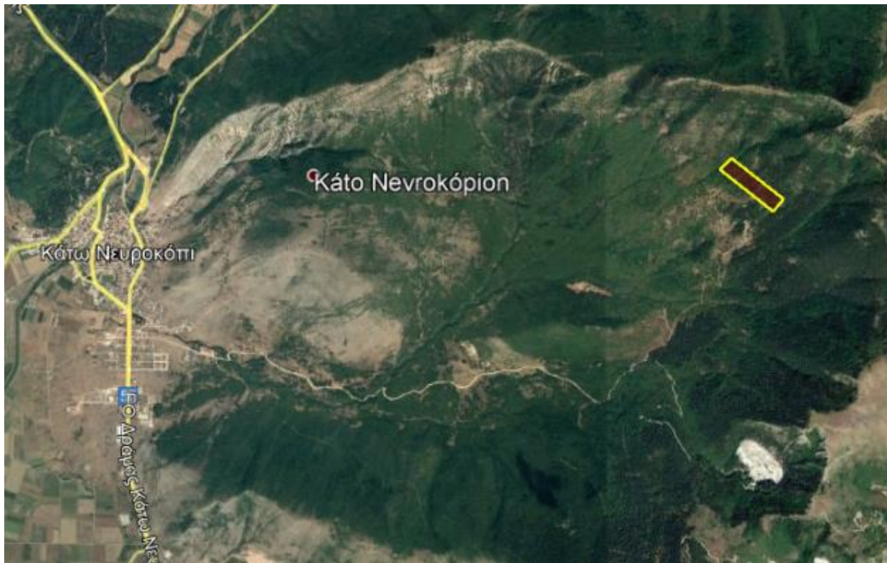
Απόσπασμα Google Earth.