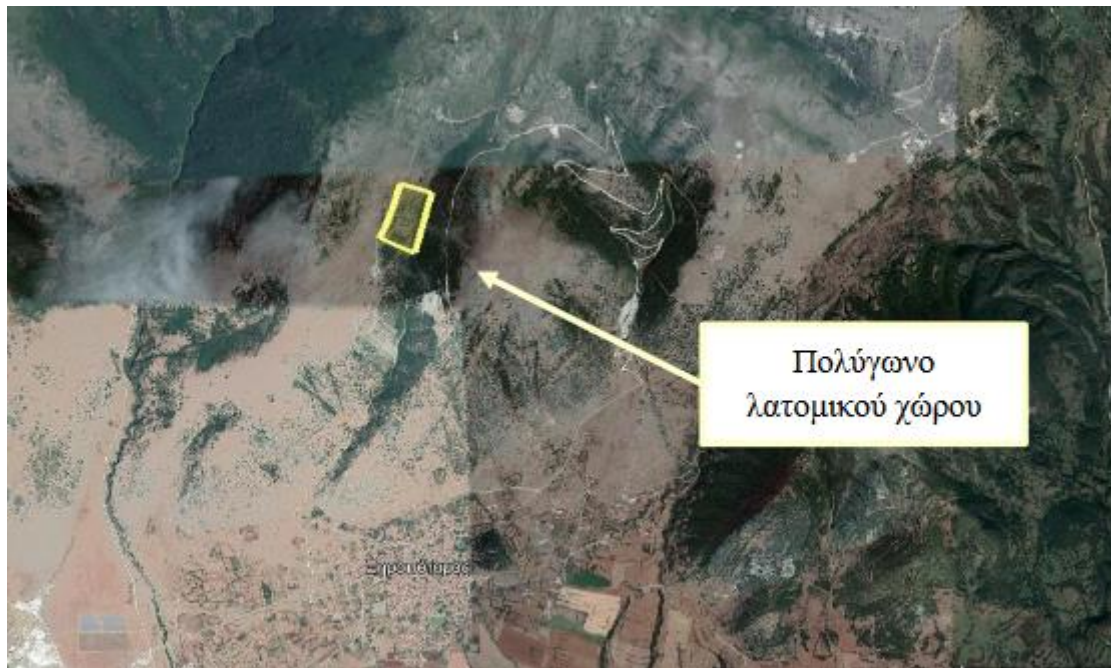
Απόσπασμα Google Earth.