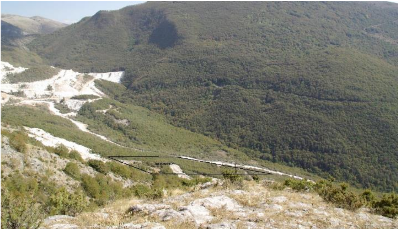
Φωτογραφία ευρύτερης περιοχής.