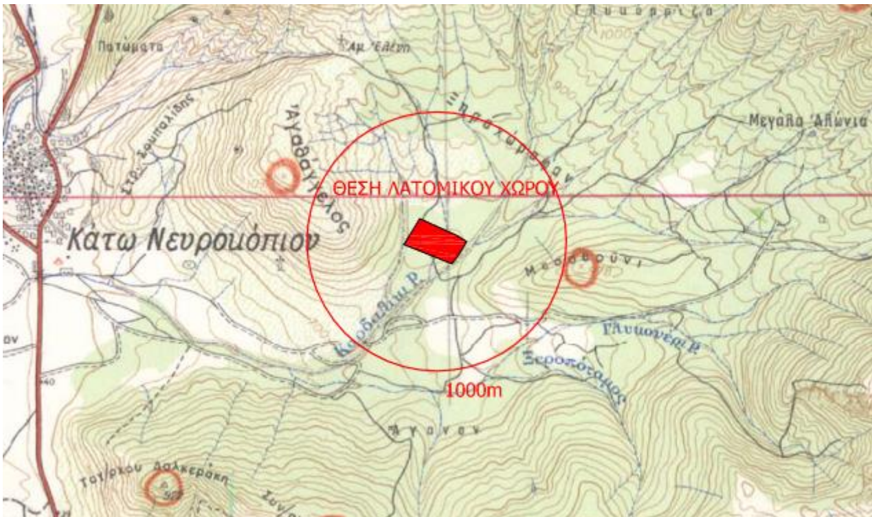
Απόσπασμα χάρτη προσανατολισμού.

Η περιοχή όπου βρίσκεται ο λατομικός χώρος είναι δημόσια δασική έκταση, υπάγεται διοικητικά στην Π.Ε. Δράμας και δασοδιοικητικά στο Δασαρχείο Κ. Νευροκοπίου