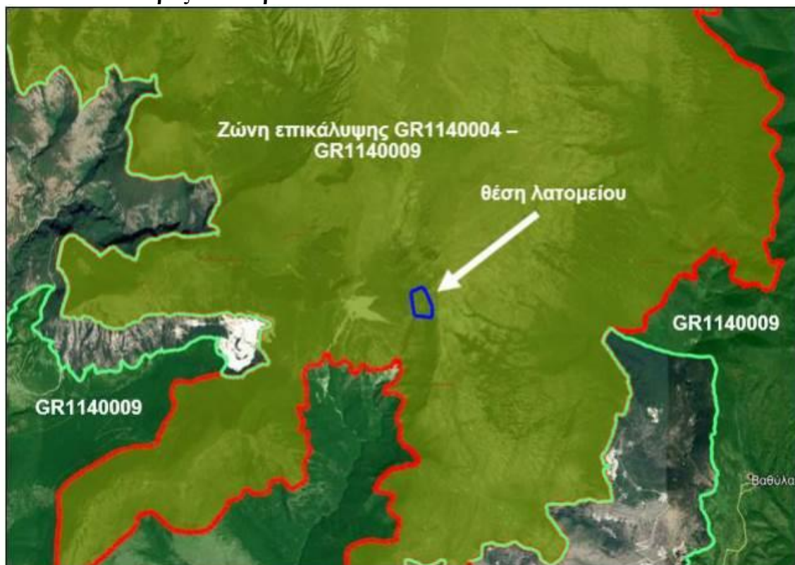
Εικόνα 1. Προστατευόμενες περιοχές – θέση λατομικού χώρου.

Ο δρόμος και ο λατομικός χώρος βρίσκεται εντός περιοχής NATURA 2000. Η θέση του λατομείου βρίσκεται εντός των περιοχών ΕΖΔ GR1140004 «Κορυφές Όρους Φαλακρό Ν. Δράμας» και ΖΕΠ GR1140009 «Όρος Φαλακρό» του δικτύου Natura 2000.