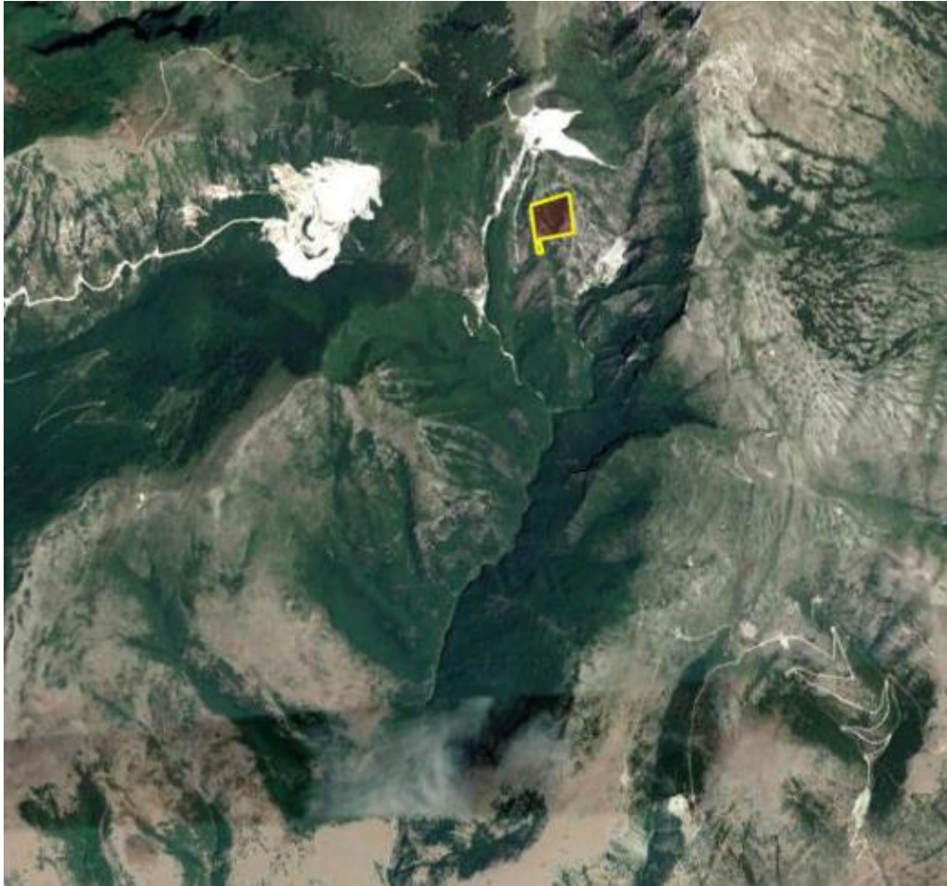
Απόσπασμα Google Earth.