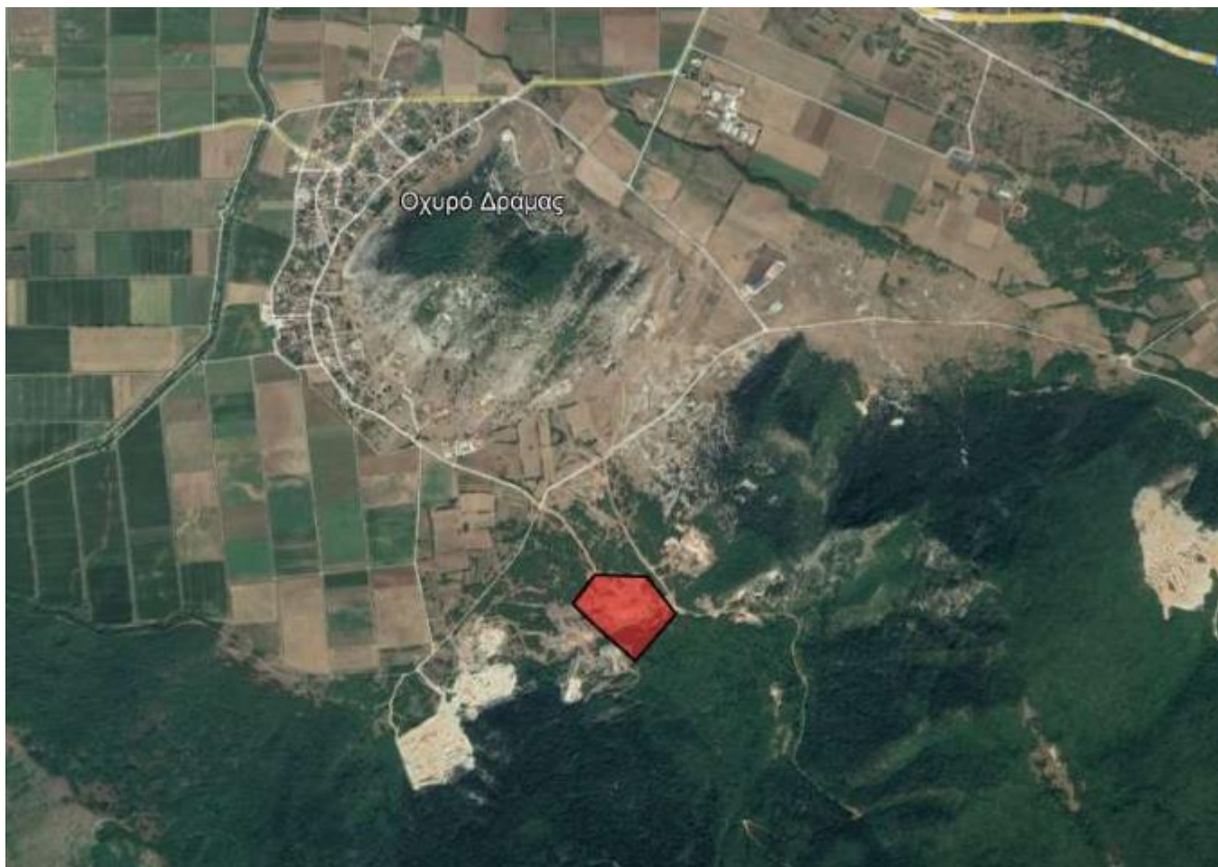
Απόσπασμα Google Earth.