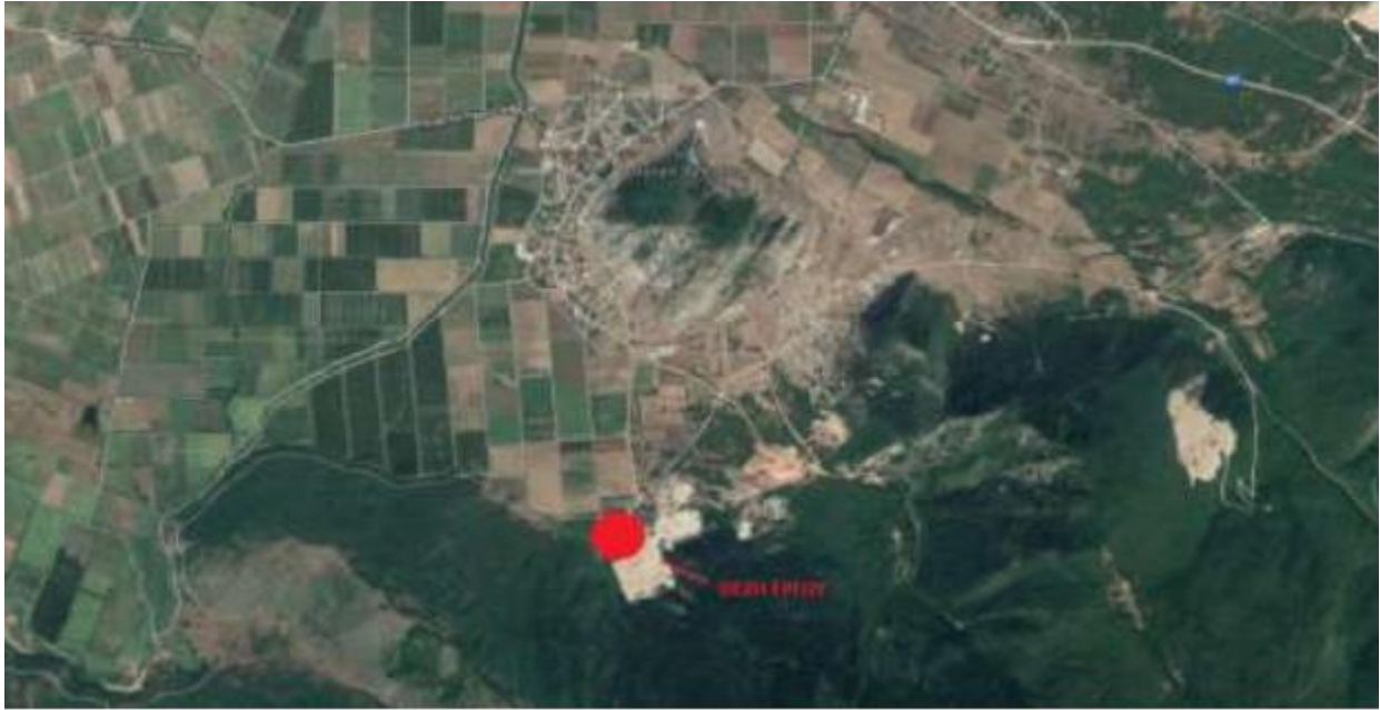
Απόσπασμα Google Earth.