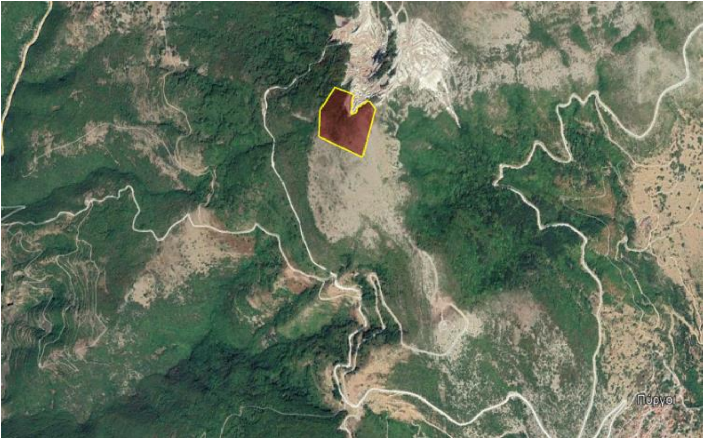
Φωτογραφία ευρύτερης περιοχής.