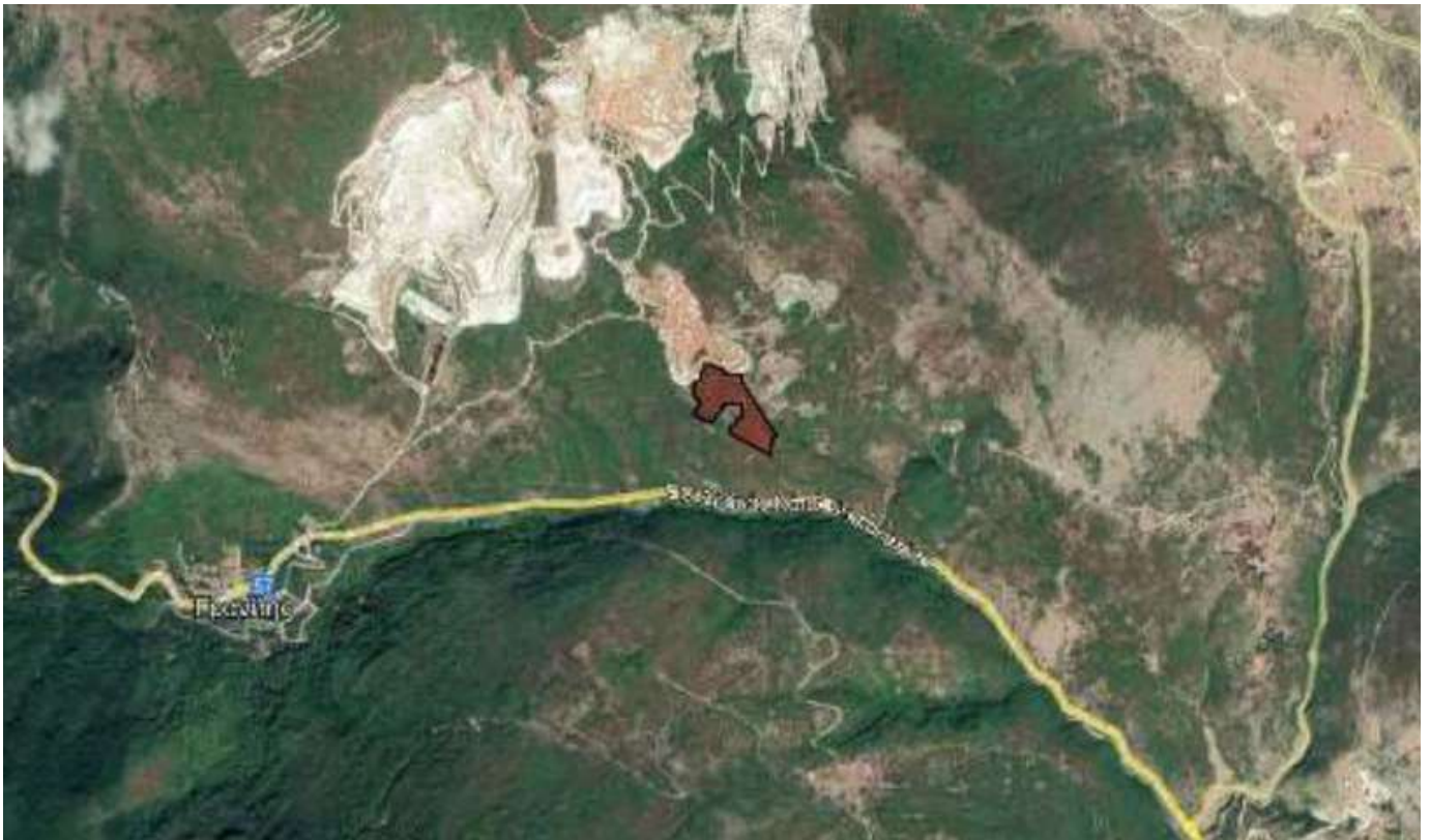
Απόσπασμα Google Earth.