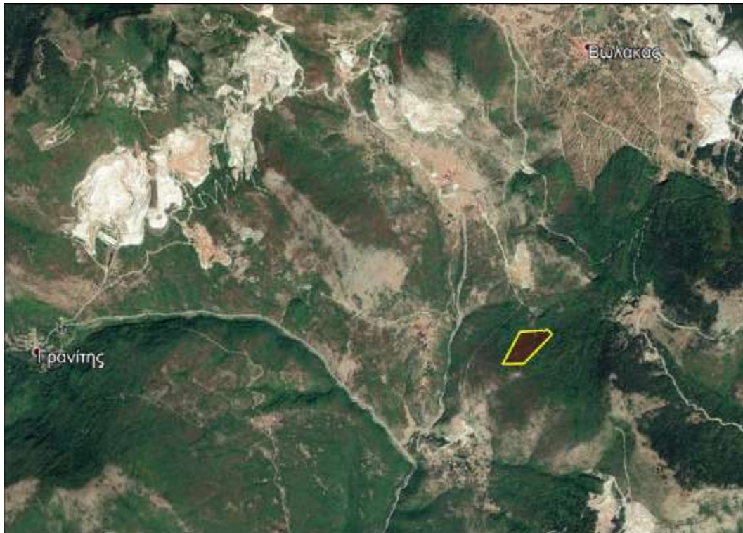
Αεροφωτογραφία της ευρύτερης περιοχής μελέτης

Η περιοχή που πρόκειται να γίνουν οι εργασίες εκμετάλλευσης, είναι ορεινή ημιορεινή δασική έκταση, με κλίση της τάξης του 40%, σε υψόμετρο 910 - 980 περίπου μέτρων. Η βλάστηση που υπάρχει στην περιοχή αποτελείται κυρίως από πλατύφυλλα είδη.